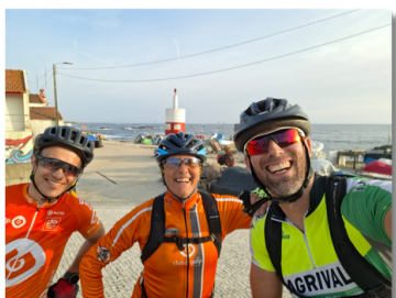
TREINOS DE BICICLETA