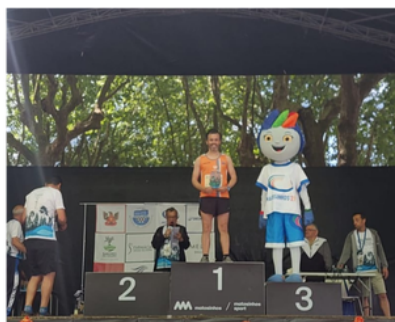
ECO TRAIL MARGENS DO LEÇA