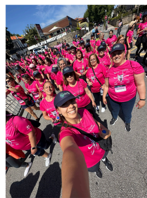
19ª EDP CORRIDA DA MULHER