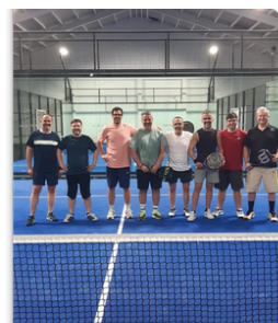
TREINOS DE PADEL