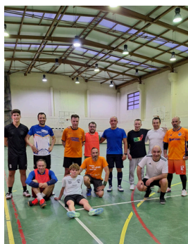
TREINOS DE FUTSAL